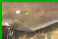
Bretagne Grands Migrateurs

Le lucane cerf-volant ( Lucanus cervus ) pond ses œufs à proximité sa nourriture préférée : le bois mort.